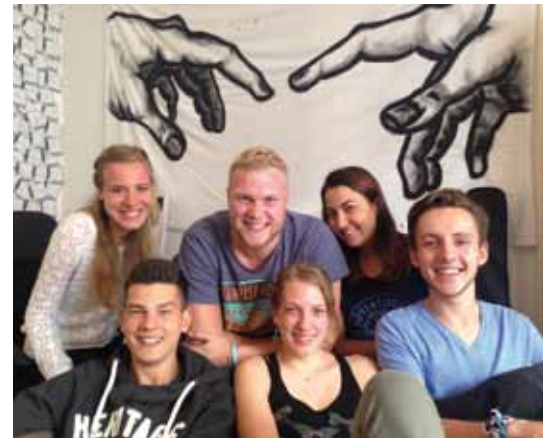
Ein Jahr für Jesus – das Team ist eine Glaubens- und Lebensgemeinschaft.