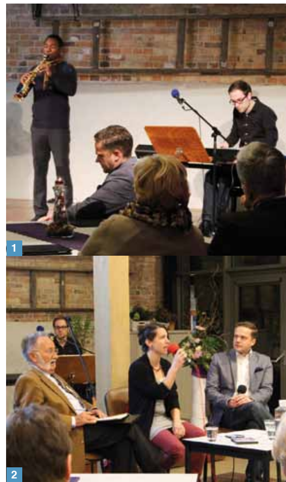
1 Es gab exzellente Musikbeiträge.

Die Frühjahrstagung in Mühlenrahmede (4.– 6. März) wird sich mit dem gewichtigen Thema des menschlichen Leids beschäftigen. Auch dazu sind wieder kompetente Referenten eingeladen. Anmeldungen wie immer über das Büro des Norddeutschen Verbandes.