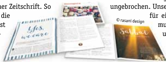
Youngsta im neuen Look.

Neugierig geworden? Youngsta kennenlernen oder verschenken – mit einem Jahresgeschenkabo. Mehr Informationen unter www.youngsta.info