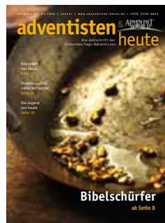
Schätze wollen gehoben werden.

Spendenkonto: Freikirche der STA, IBAN: DE14 6009 0100 0227 3850 04, BIC: VOBAD53333, Verwendungszweck: Aheu-Finanzierung